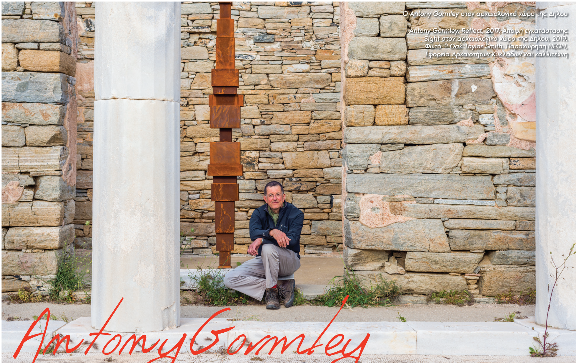
Ο Antony Gormley στον αρχαιολογικό χώρο της Δήλου