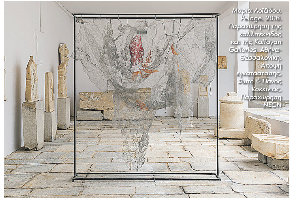
Μαρία Λοϊζίδου, Pelage, 2018. Παραχώρηση της καλλιτέχνιδος και της Kalfayan Galleries, Αθήνα-Θεσσαλονίκη. Αποψη εγκατάσταση. Φωτό © Πάνος Κοκκινιάς. Παραχώρηση NEON