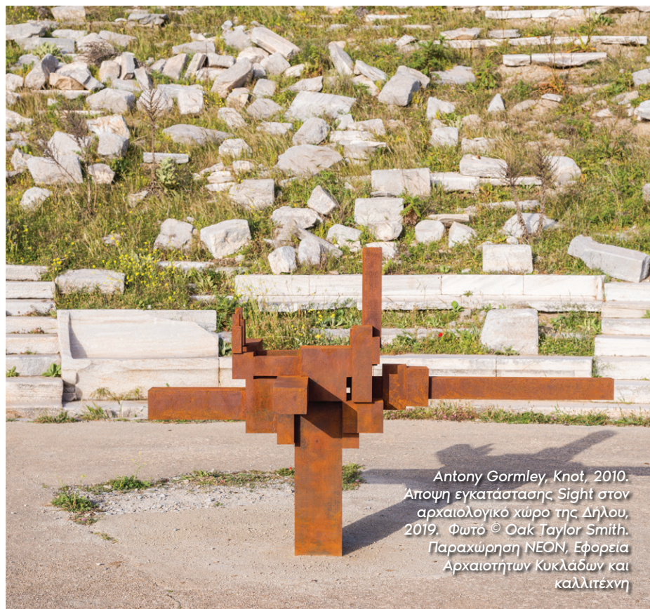
Antony Gormley, Knot, 2010. Αποψη εγκατάστασης Sight στον αρχαιολογικό χώρο της Δήλου, 2019. Φωτό © Oak Taylor Smith. Παραχώρηση ΝΕΟΝ, Εφορεία Αρχαιοτήτων Κυκλάδων και Καλλιτέχνη

Τα γλυπτά μου αποτελούν εγγραφή μιας βιωμένης στιγμής του ανθρώπινου χρόνου που αιχμαλωτίζω επί 30 χρόνια με εκμαγεία και με τη μέθοδο της ψηφιακής σάρωσης. Βλέπω τα έργα μου ως απουσίες: είναι κενά, δεν έχουν τίποτα να κάνουν, δεν σημαίνουν τίποτα πέρα από έναν ανθρώπινο χώρο στο σύμπαν. Περιμένουν, σαν παγίδα, να αιχμαλωτίσουν τη σκέψη, τα συναισθήματα και την κίνηση ενός θεατή. Χρειάζεται να περπατήσεις γύρω τους για να ξεκινήσεις μια σχέση μαζί τους. Σε αυτή μπορεί να βρίσκεται η αρχή μιας μορφής αξίας, στη σχέση του θεατή με αυτό που βλέπει: έτσι, αυτή η ιδέα της συμπαραγωγής, «το μερίδιο του θεατή» κατά τον Gombrich, έχει πραγματική ουσία.