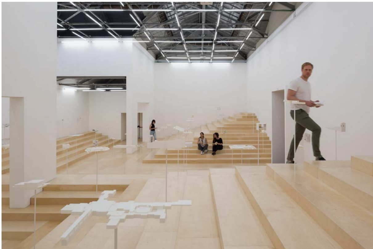
Η Σχολή των Αθηνών, Neiheiser Argyros

Με τίτλο "Η Σχολή των Αθηνών", το έργο εξετάζει την αρχιτεκτονική των ακαδημαϊκών κοινών - από την ακαδημία του Πλάτωνα μέχρι σύγχρονα πανεπιστημιακά σχέδια. Αναφερόμενο στη διάσημη νωπογραφία του Ραφαήλ, το Περίπτερο μεταμορφώνεται σε ένα κλιμακωτό τοπίο - "ελεύθερο χώρο", άτυπο και κοινό, προσκαλώντας τους επισκέπτες να περιφερθούν και να ζωντανέψουν τις πενήντα-έξι τρισδιάστατες μακέτες ακαδημαϊκών χώρων, εν ενεργεία και μη, από όλη την ιστορία και όλο τον κόσμο. Η έκθεση θα διαρκέσει από τις 26 Μαΐου έως τις 25 Νοεμβρίου 2018 (Προεπισκόπηση 24 και 25 Μαΐου) στο Giardini Βενετίας της Ιταλίας.