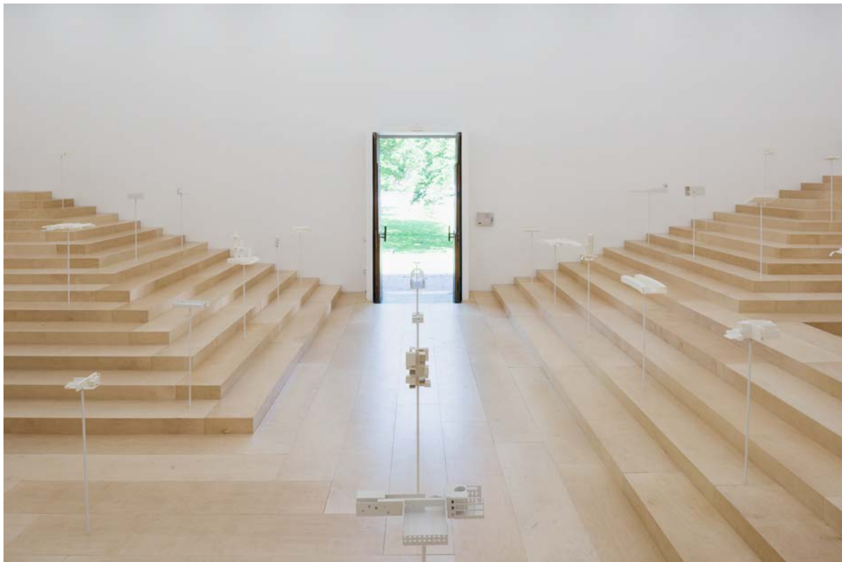
Η Σχολή των Αθηνών, Neiheiser Argiros, φωτογραφία Ugo Carmeni

άκρες κατακόρυφων χαλύβδινων ράβδων, και είναι οργανωμένες σε έναν κάναβο που γεμίζει ισότιμα προς όλες τις κατευθύνσεις το χώρο του ελληνικού περιπτέρου.