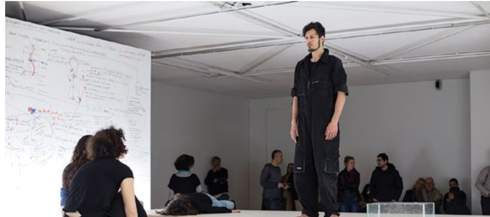
Ο sound artist Λάμπρος Πηνιούνης διερευνά το ακουστικό περιβάλλον και ειδικότερα την «οικολογία του φόβου». Βρίσκεται πάνω σε μια πλατφόρμα, κάτω από την οποία υπάρχει ένα σύστημα παραγωγής υπόκωφων συχνότητας ήχου που ενεργοποιείται από την κίνηση του κοινού. Όπως λέει: «Στο project δημιουργείται μια σχέση ενοχής μεταξύ του κοινού και εμένα, χωρίς το κοινό να το γνωρίζει. Η συνειδητή επίδραση του ήχου στο σώμα μας είναι μια άλλου είδους βία». [Μικροπολιτικές Θυρώβου].