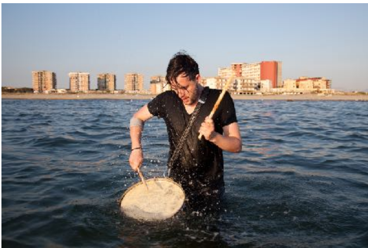
Castle Volturno, 2010, Raphael Sbrzesny

Tinos Quarry Platform / Ίδρυμα Τηνιακού Πολιτισμού Τήνος • 05.07.2017